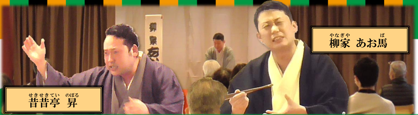
やなぎや 柳家 あお馬