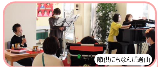
節供にちなんだ選曲

品目は『ちらし寿司』、『だし巻玉子』、『鶏もも竜田揚げ・さくらのタルタルソース添え』、『ポテトサラダ』、『お漬物』、『鞠麩と花麩のお吸い物』、『ひし形三色ゼリー』の春らしい色鮮やかな重箱弁当でした。