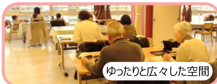
ゆったりと広々した空間

中には生まれて初めて“ちらし寿司”を食べたお子さんも！初めての味を“みんなの節供”で体験頂けた事が嬉しく心がじんわりと暖かくなりました。この節供イベントは、食を通して季節の節目を老若男女でお祝いすると共に、この地域で仕事をする私達にとって、ご参加頂くお子さん達の成長を見守る役割もあると実感しました。