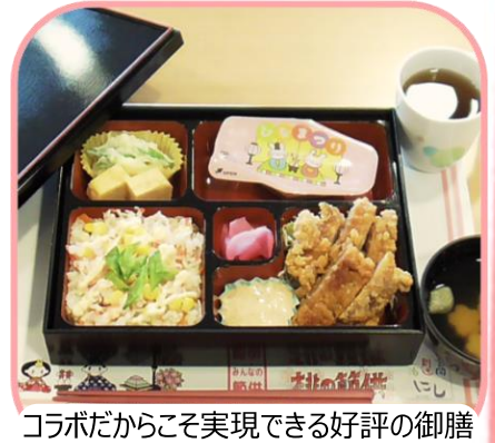
コラボだからこそ実現できる好評の御膳

中には生まれて初めて“ちらし寿司”を食べたお子さんも！初めての味を“みんなの節供”で体験頂けた事が嬉しく心がじんわりと暖かくなりました。この節供イベントは、食を通して季節の節目を老若男女でお祝いすると共に、この地域で仕事をする私達にとって、ご参加頂くお子さん達の成長を見守る役割もあると実感しました。