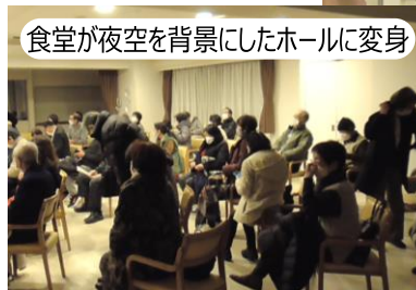
食堂が夜空を背景にしたホールに変身