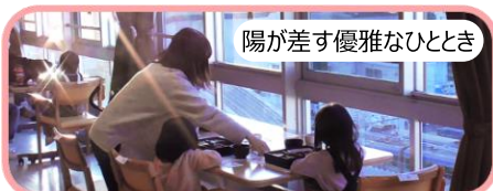
陽が差す優雅なひととき