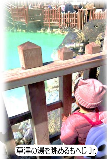
草津の湯を眺めるもへじ Jr.

生活創造空間にし URL： http://www.souzokuukannishi.org