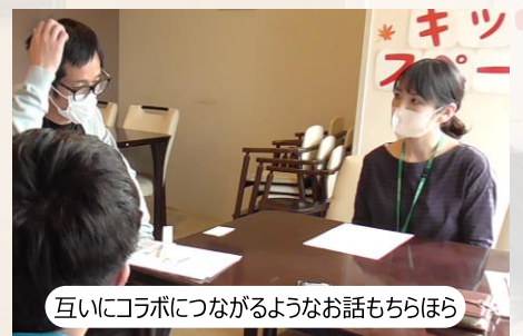
互いにコラボにつながるようなお話もちらほら

【小菅】実習生さんなどにも必ずお伝えしていることとして、「皆さんに伝わるようにあいさつを丁寧にする。」ことを伝えています。言葉でのコミュニケーションが難しい方もいる中でしっかり目を見て、ご本人の発信を少しでも待つとか、こちらの流れ・リズムで支援を進めず、ご本人のペースを大切にします。そういった支援を大切にしています。