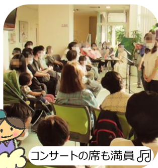
コンサートの席も満員🎵