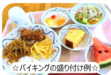
☆バイキングの盛り付け例☆

久しぶりのバイキングスタイルでのお食事は、枝豆ごはん・焼きそば・フライドポテト・鶏唐揚げ・豚しゃぶサラダ、デザートにフルーツポンチ・スイカ・はちみつレモンパウンドケーキ・わたあめの計9種類からなる豪華ラインナップ。「バイキングスタイルの食事が楽しかった。」「たくさんおかわりした！」という声も聴こえてきました。(香西)