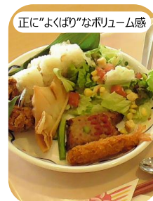
正に"よくばり"なボリューム感