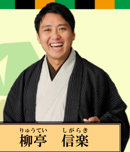
りゅうてい しがらき 柳亭 信楽