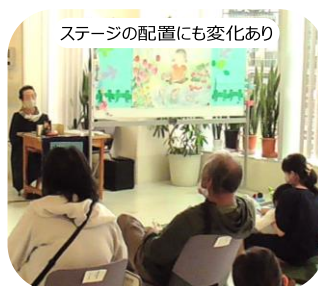
ステージの配置にも変化あり

『おでかけ3』や、節供のイベントに馴染みがあるよ 「障がいのある方が利用する施設だったとは知らなかったよ」 というお声も聴こえてきました。