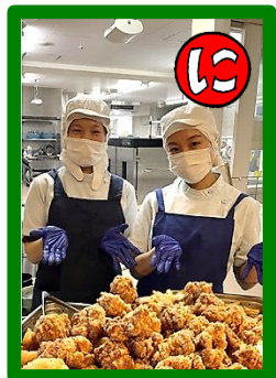
ニッコトラスト名物 鶏のからあげ