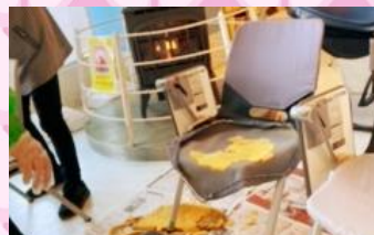
経年劣化によりクッションの入れ替えも...