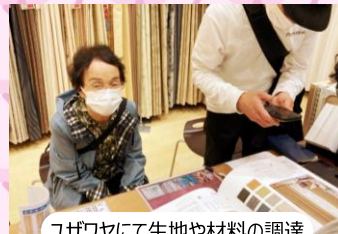
ユザワヤにて生地や材料の調達