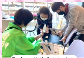
取り外しの効くカバーになりました