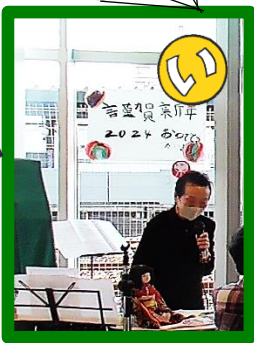
居心地良い音楽と心地良いMC