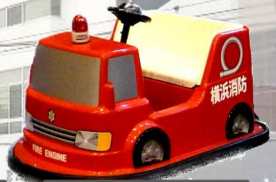
バッテリーカー乗車体験