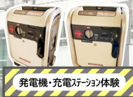
発電機・充電ステーション体験