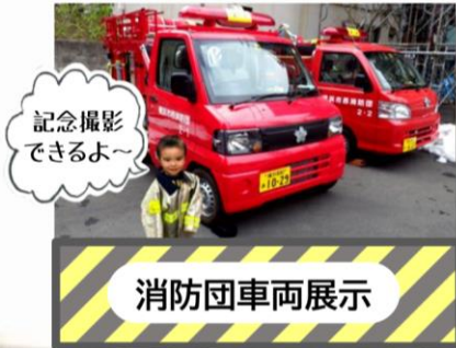
記念撮影 できるよ～