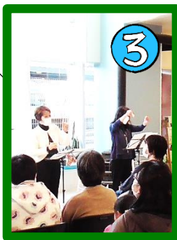
朗読と演奏の楽しいコンサート