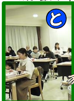
ともに集い!! ともに笑おう!!