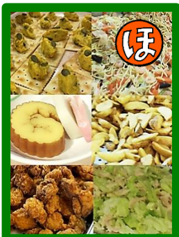
ほっぺがおちるくらい 美味しいごちそう