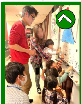
平和で健康に すぐせますように