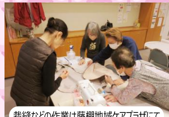
裁縫などの作業は藤棚地域ケアプラザにて