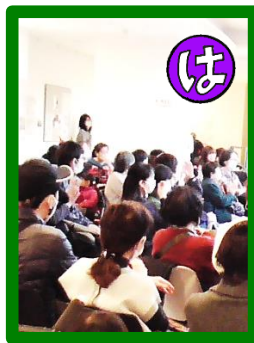
ハーモニーは会場と一本になって